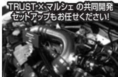
TRUST×マルシェの共同開発 セットアップもお任せください!