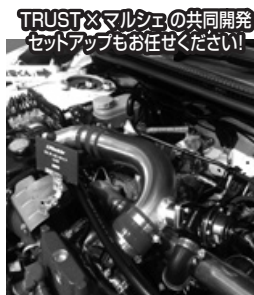
TRUST×マルシェの共同開発 セットアップもお任せください!

● VAB専用 タービンキット価格 ¥544,500(税込) 純正インタークーラー対応